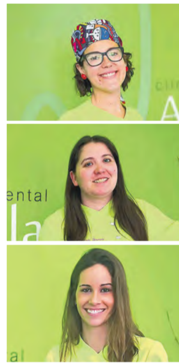
Equipo de clínica dental Ayala

Desde marzo estamos aplicando un estricto protocolo, cuyas directrices las marca el Colegio