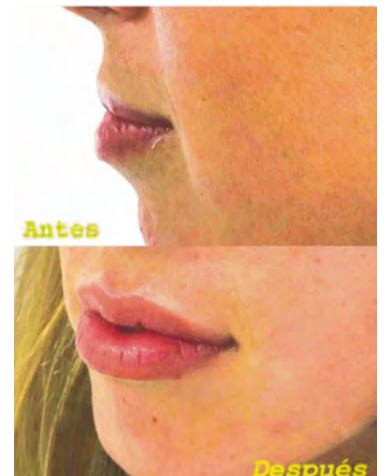
Técnica de aumento de labio