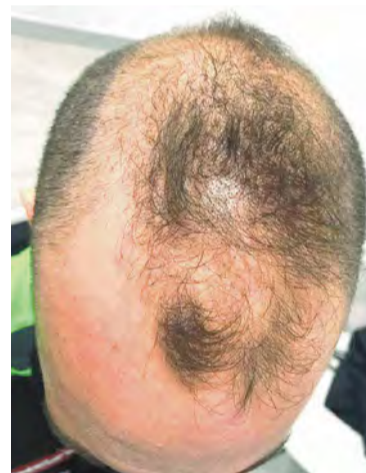
Tratamiento capilar, antes y después